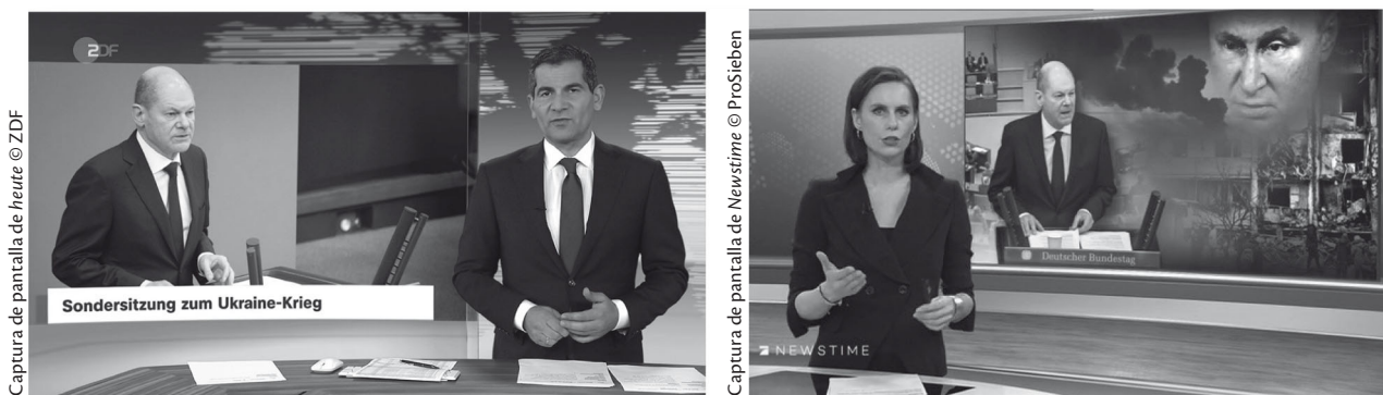
Ill. 5 y 6: Dramatizando con el uso de imágenes de fondo: Una imagen sencilla en heute (izquierda) y un montaje fotográfico dramático en Newstime (derecha)