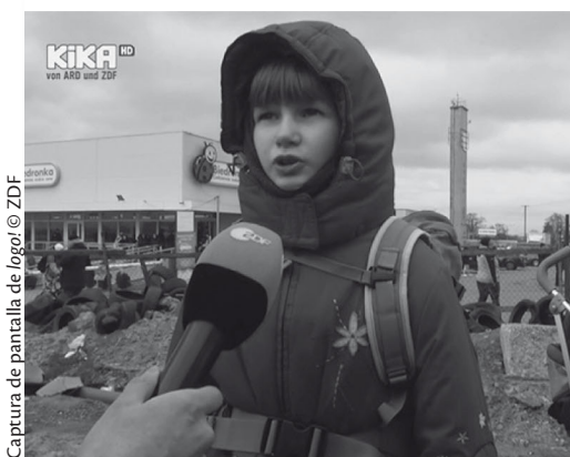
Captura de pantalla de logo!

En un total del 7% de todas las historias analizadas, se mostraron imágenes de personas fallecidas. Esto ocurrió el doble de frecuente en los programas de emisoras privadas (10%) en comparación con los programas de las emisoras públicas (5%), y las imágenes fueron mostradas principalmente en el período de evaluación 3 (comenzando con el informe sobre los crímenes de guerra en Bucha). En una cuarta parte de las historias a principios de abril, se podían ver personas fallecidas. En tagesschau , RTL Aktuell y Newstime , al menos los rostros o los cuerpos estaban borrosos. Solamente primeros planos, por ejemplo de manos atadas, se mostraron sin difuminar la imagen. En heute , los fallecidos fueron mostrados sin difuminar la imagen poquísimos casos, pero no se mostraron en primer plano y, de ser así, no se podían ver rostros. La mayoría de las personas fallecidas mostradas eran civiles adultos. (58%). Un poco menos de un tercio de las personas muertas no se pudieron identificar más específicamente, y el