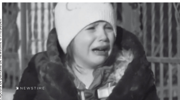
Captura de pantalla de Newstime