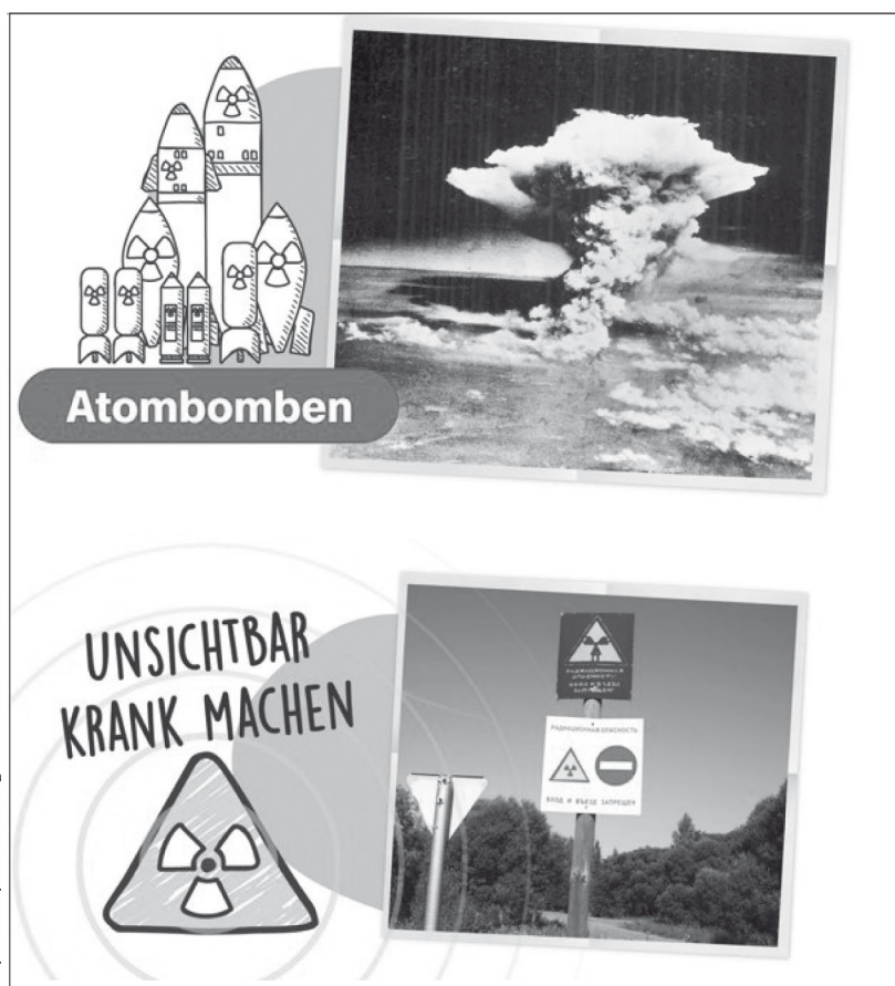
Captura de pantalla de logo!