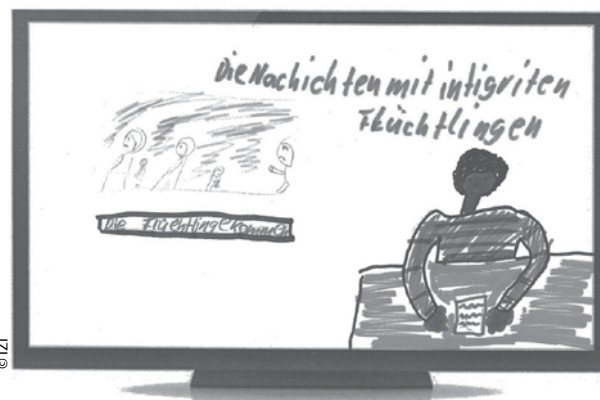
III. 2: Hannah de 11 años quiere un programa de noticias en el que los mismos refugiados presenten la información sobre este tema.

Más allá del tema fue importante para los niños y adolescentes escuchar exactamente cómo se sienten los refugiados y cómo estaban manejando lo que