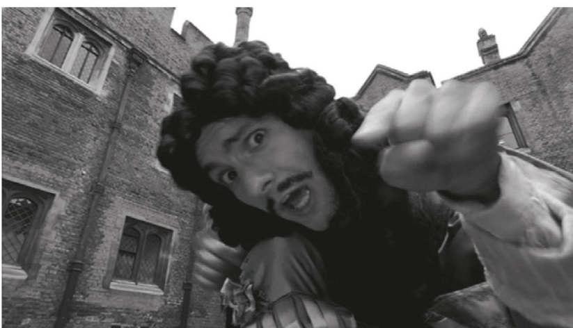
III. 2: Creativo y atractivo para los jóvenes: Carlos II interpreta un rap “King of Bling” (Rey de la ostentación) y afirma que él rescató la diversión luego de un período puritano.