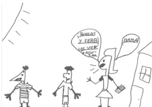
11.2 “Phineas and Ferbs, te voy a acusar” una niña de Argentina de 9 años aprendió de Phineas and Ferb que “nunca se debe acusar”

pur+ “Que cuando un avión hace una picada con los motores encendidos se flota como si se estuviera en el espacio” y dibuja la escena correspondiente del programa educativo (III.1)