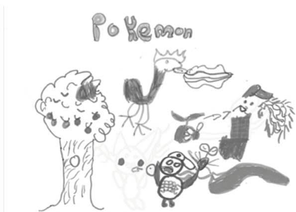
III.3 Una niña de 8 años del Reino Unido aprendió con Pokémon que las bayas pueden envenenarnos”