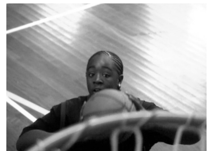
III 3: Sin embargo a él le encanta jugar al básquet