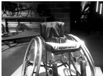
III 5: El hermano de Kyle lo ayuda a obtener una nueva silla de ruedas deportiva