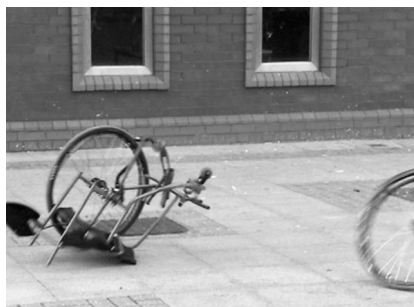
III 8: ...y tira su silla de ruedas nueva por el balcón