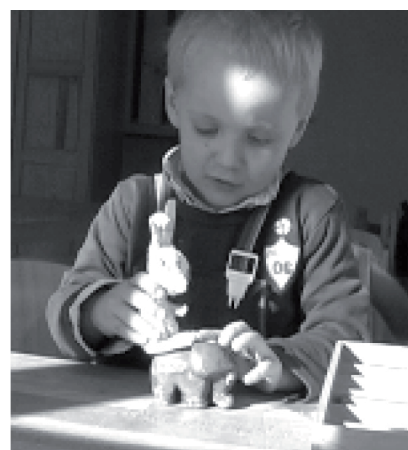
III.1: Situación lúdica con el nuevo conejito y el elefante

El nuevo personaje debía ser un conejito que debía ser emocionalmente expresivo, lleno de energía, creativo y una especie de hermana mayor para el personaje principal, el pequeño elefante azul. Con el fin de encajar en el elenco existente, el personaje debía ser rosado debido a ciertas razones de producción. Por causa del color, las niñas tendrían potencialmente mayor afinidad con el nuevo personaje y al principio éste fue creado de acuerdo con este factor: los diseñadores dibujaron una figura con una cabeza sobredimensionada, una garganta delgada, una sonrisa pícaro, insinuante y cintas atadas a sus orejas.