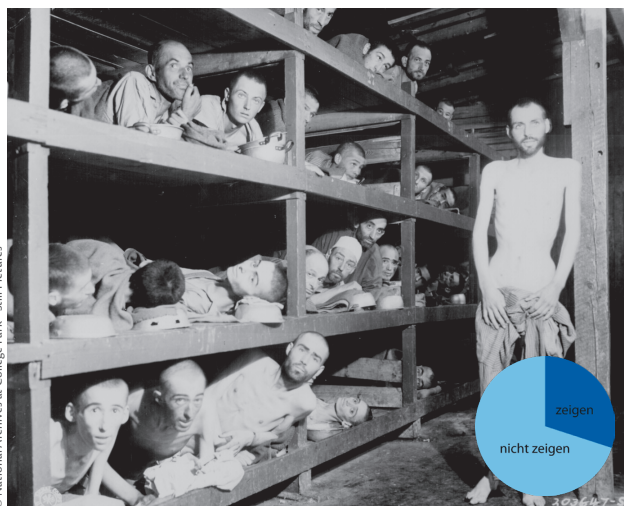
Abb. 1: Darstellungen von abgemagerten Häftlingen in Konzentrationslagern (hier: KZ Buchenwald) schätzen die befragten PädagogInnen für Grundschul Kinder als ungeeignet und emotional überfordernd ein

Das Erlangen dieser tiefen und unangenehmen Erkenntnis kann eine linear erzählte Geschichte aus Opferperspektive aber nicht leisten (Deckert-Peaceman, 2002, S. 317). Ein angemessener Ansatz muss Mehrperspektivität ermöglichen, die sowohl die Opferperspektive als auch die Perspektive der Täter, Zuschauenden und MitläuferInnen in den Blick nimmt (Flügel, 2009). »Erziehung nach Auschwitz« heißt, sich mit dem Grauen von Auschwitz auseinanderzusetzen und gesellschaftliche Bedingungen, die dies ermöglichten, zu begreifen (Adorno, 1971). Gleichzeitig geht es im weiteren Sinne um die Förderung grundlegender Werte, wie die Anerkennung und Akzeptanz eines anderen Menschen in seiner Besonderheit, sowie den Mut zum Nicht-Mitmachen. Pädagogisches Ziel muss entsprechend auch sein, Empathie mit Opfern, Zuschauenden und auch TäterInnen zu ermöglichen, um dann eine moralisch fundierte Position gegen die Intoleranz und Zerstörung zu ermöglichen (Pech, 2004). Als empirisch wirksamer und angemessener Zugang haben sich in der Grundschuldidaktik Lebensgeschichten historischer Figuren erwiesen. Bei