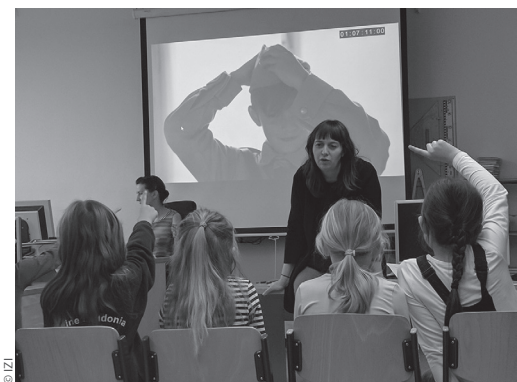
Abb. 2: Der Rohschnitt der Serie Der Krieg und ich wurde mit SchülerInnen der Klassen 3 und 4 getestet

Sobald eine erste Fassung der Serie bereitstand, wurde diese SchülerInnen der Klassen 3 und 4 gezeigt und auf Attraktivität, Verständlichkeit und inhaltliche Wirksamkeit hin getestet (Abb. 2). Die Methoden waren abermals die schriftliche Vorher-nachher-Befragung sowie