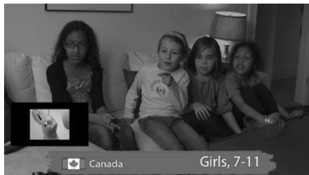
Abb. 3: Die begleitende Musik zum Clip des Schokoladenhasen regt die Zuschauerinnen an, das Geschehen zu kommentieren

Aber was wäre, wenn die Vertonung anders angelegt gewesen wäre?