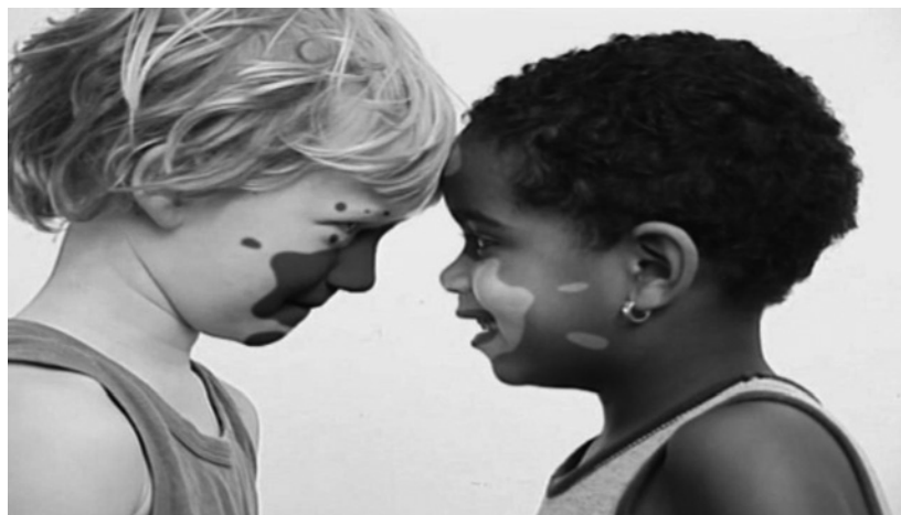
Abb. 5 und 6: »I get yours, you get mine«: Die Gesichter eines hellhäutigen und eines dunkelhäutigen Jungen kommen sich immer näher, bis sie sich berühren und schließlich verfärben

Was, wenn der Bildinhalt nicht schon an sich eine eindeutige Bedeutung hat? Welche Bedeutung kann dann unterschiedlichen Vertonungen zukommen?