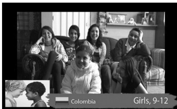
Abb. 7: Eine romantische Vertonung von »I get yours, you get mine« regt die Kinder zum Kichern an

Diese Variante des Clips sahen 36 Kinder (6 bis 12 Jahre) aus 5 Ländern. Das Ergebnis: Bei dieser Vertonung wird deutlich weniger gelächelt oder gelacht. Stattdessen ist in der ersten Hälfte bei jedem fünften Kind eine deutliche Anspannung zu sehen. Diese löst sich dann in fast allen Fällen beim Höhepunkt des Clips in Überraschung auf.