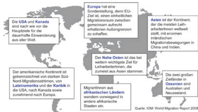
Abb. 2: Weltweite Migrationstrends – ein Überblick