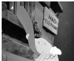
Abb. 4: Dumbo verliert seine Mutter, gezeichnet von Tanja, 19 Jahre (li.), Rezeption mit 4 bis 5 Jahren, Screenshot aus Dumbo (re.)

Katze und da habe ich schon Angst bekommen [...], dass die mich anhaucht und ich auch eine Katze werde und dann böse werde.« Anders als bei den bedrohlichen Wesen steht hier nicht die Furcht vor einer Figur im Vordergrund, sondern eine Situation, mit der sich die Kinder durch die Vermischung von real Möglichem und Irrealem überfordert fühlen.